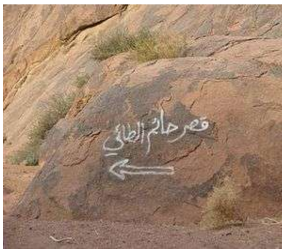
Роҳ ба сӯи манзили Ҳотами Той