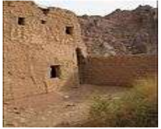
Кӯҳи мавзеи Ҳотам