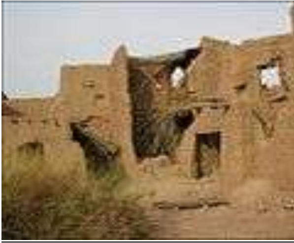
Қасри Ҳотам Даруни кохи Ҳотам