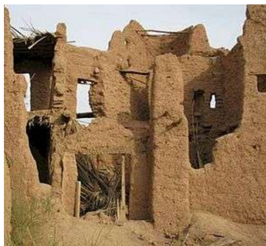
Қасри Ҳотами Той