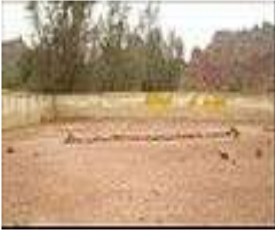
Муҳтавои қабри Ҳотам