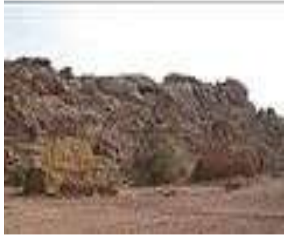
Кӯҳи Эҷо (أجا)