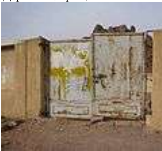
Мавзеи зисти Ҳотами Той